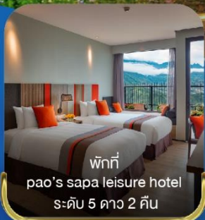
พักที่ pao's sapa leisure hotel ระดับ 5 ดาว 2 คืน