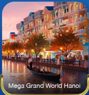
Mega Grand World Hanoi