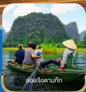
ล่องเรือตามที