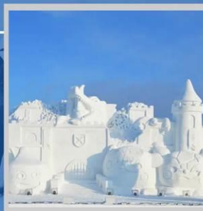
"ASAHIKAWA SNOW FEST"