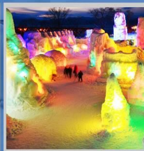
"SHIKOTSU ICE FEST"