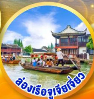
ล่องเรือจูเจียเจี๋ย