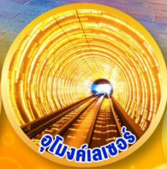
อุโมงค์ลาฮอร์