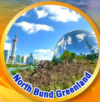
North Bund Greenland