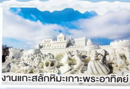
งานแกะสลักหิมะเกาะพระอาทิตย์