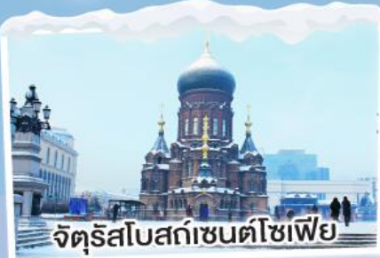
จัตุรัสโบสถ์เซนต์โซเฟีย