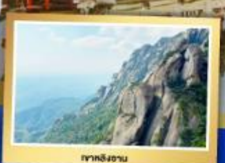
ภูเขาผิงซาน