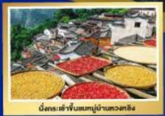
นี่กระเช้าขึ้นชมหมู่บ้านทวดัง