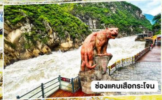
ช่องแคบลีโงว