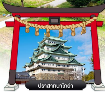
ปราสาทนาโกย่า