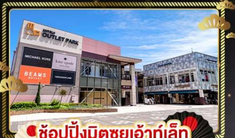
ช้อปปิ้งมิตซูยาอ่ากเล็ก