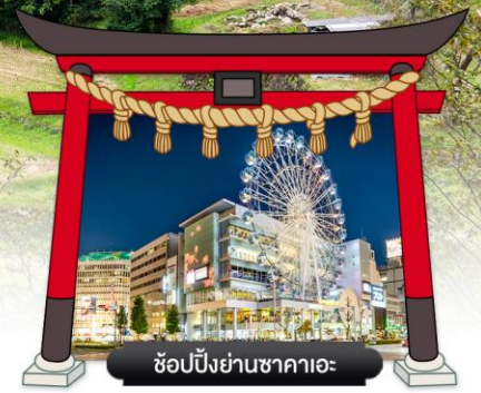
ช้อปปิ้งย่านซากาเอะ