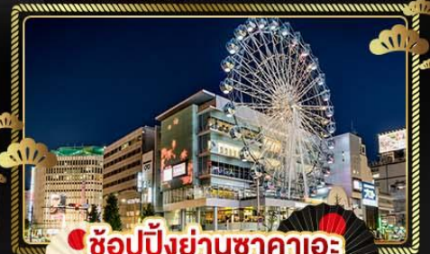
ช้อปปิ้งย่านซากาเอะ