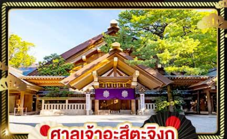
ศาลเจ้าอะสึตะจิงกุ