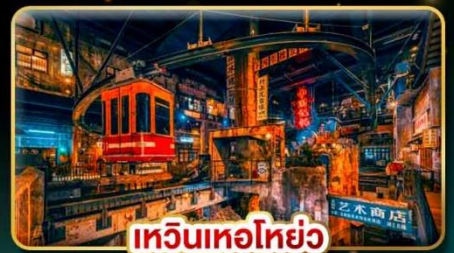
เหวินเหอโฮ่ย