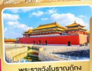
พระราชวังโบราณปักกิ่ง