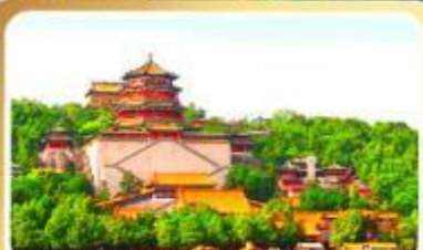
พระราชวังฤดูร้อนอี้เหอหยวน