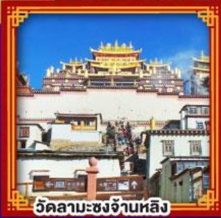
วัดลามะซงจันหลิง