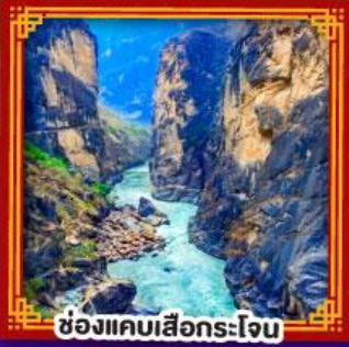
ช่องแคบเสือกะโจ