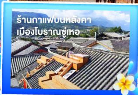
ร้านอาหารหลังคา เมืองโบราณซีเหอ