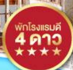
พักโรงแรมดี 4 ดาว