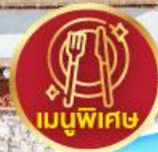
เมนูพิเศษ