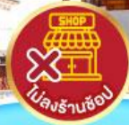
ไม่ลงร้านช้อปปิ้ง