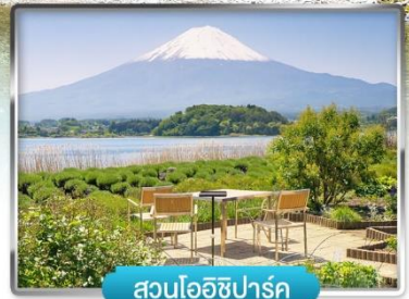
สวนโออิชิปาร์ค