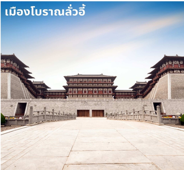
เมืองโบราณลั่วอี้